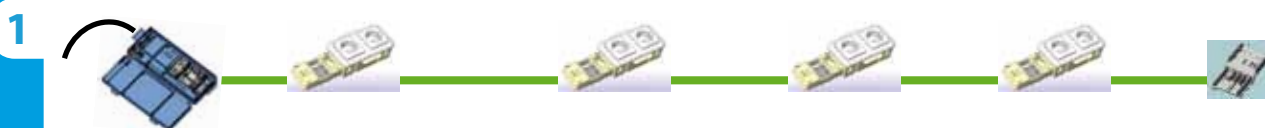
3G installatie wandgoot

Met Clixys® wint u aan tijd én kwaliteit!